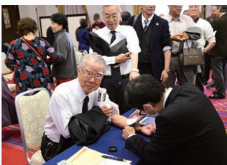
参加者の糖化年齢測定会