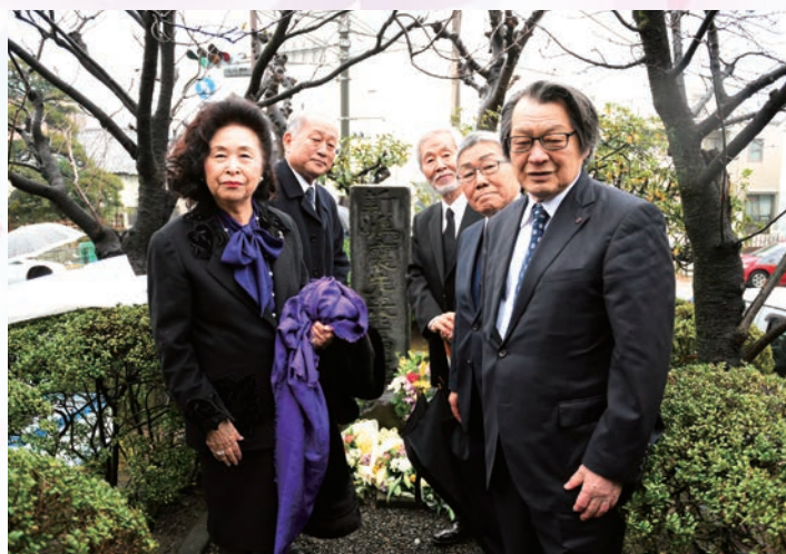
新島襄先生終焉の地 碑前にて

式は、先生が亡くなられた14時20分より、学校法人同志社柳井望法人事務部長の司会で始ま