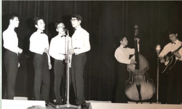
シルバー・ゲート・カルテット(左から2番目が筆者)