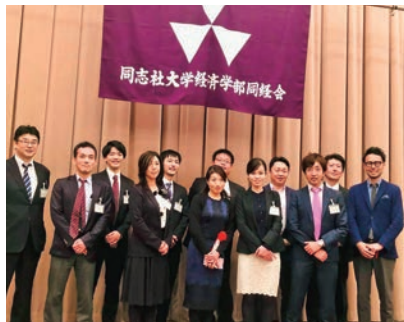
経済学部の同窓会「同経会」にて