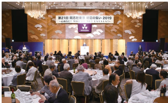
「初夏の集い2019」(ホテルニューオータニ)