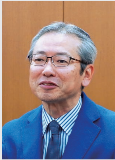
困難な時も笑顔を忘れずにいたい

1960年(昭和35年)生まれ 1984年(昭和59年)同志社大学 商学部卒業 同年インテック入社 2015年インテックBPO事業本部長 2016年執行役員 企画本部長 2017年常務執行役員 2018年4月より代表取締役社長