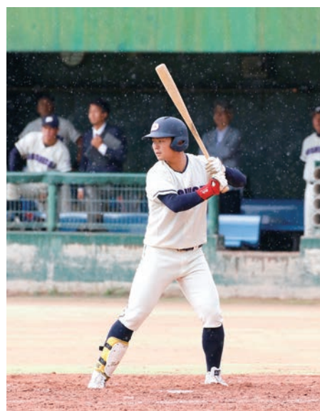
打席に立つ新主将・四川

躍を期待したい。 道端(法2)はツーシームで打者の芯を外し、打たせて取る投球が持ち味。いつだって全力投球で打者をねじ伏せる。オーソドックスな投手が多い同志社の中で、2人は貴重な戦力である。