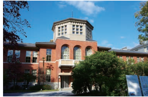
同志社女子大学 栄光館