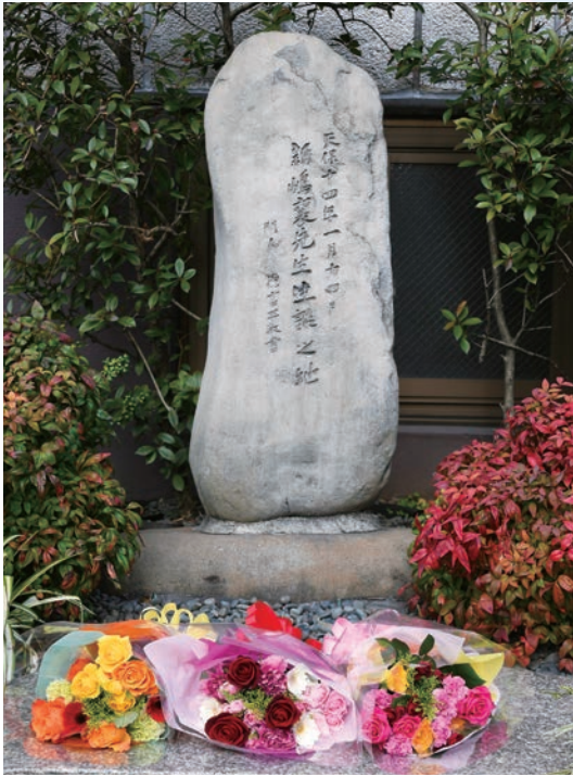
「新島襄先生生誕之地」碑