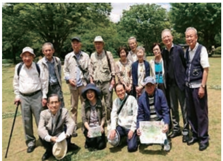
ウオーキング&食べ歩き会(2019年5月16日)

部会活動ではスケッチ部会も盛んです。年三、四回、都内近郊の公共交通機関を使って出掛けられる場所でのスケッチ会と、年一回ギャラリーでのスケッチ展を開催。仕事を卒業後、故郷の京都に移住した発起人の一人は必ず上京して参加しています。