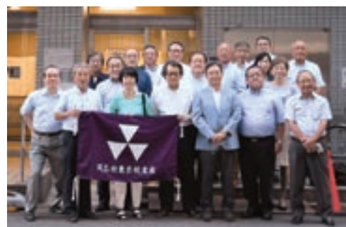
東京校友会の活動を担う常任幹事会のメンバー

二つ目は会員の皆様のご要望に合わせて企画する「各種講演会」の中止です。特に今年度は若いビジネスパーソン向けに計画しておりましたが、何もできないままになりました。