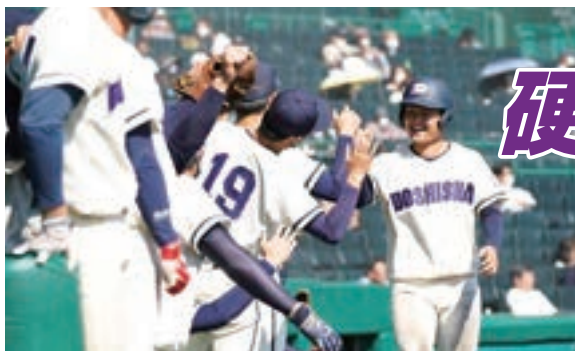
ベンチで笑顔を見せる四川