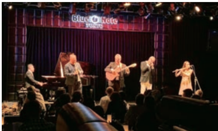
イタリアの巨匠トリオ「I Magnifici Tre」とブルーノート東京に出演(2019年)

新宿のライブハウスがまた潰れた。お客様にマスクを義務付け、乾杯も握手も禁止、舞台に