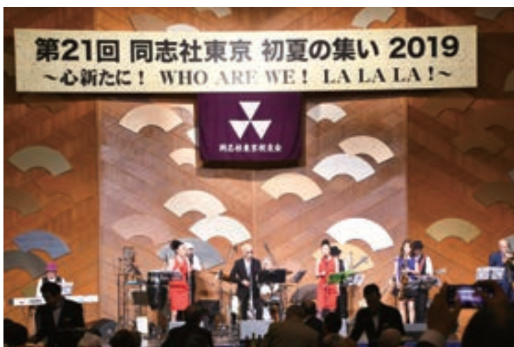
初夏の集い 2019 スペシャルディナーショー

開催時間に関しましても、簡素化により、出来るだけ時間短縮を図り、式典、講演会、懇親会を含めて正午より、3時間半で全て終了するように予定しております。詳細の式次第につきましてはまだ決定しておりませんが、現時点ではとにかく「安全」「安心」第一の会を準備しております。 ＊ 21回も開催されてきた伝統あるこの同志社東京校友会の「集い」が途絶えることなく、コロナ禍のこんな時代でも無事に継