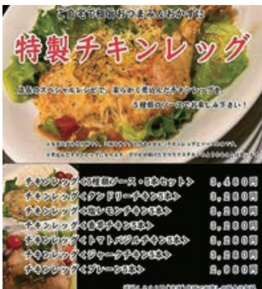
「特製チキンレッグ」のメニュー

その後6月以降少しずつ回復してはいるものの、6月で前年の50%程度、現在（11月）でも70%程度までの回復で、前年並みには戻っていないとのこと。