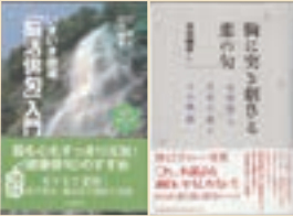
選者の著書/脳活俳句入門(ベガサス)胸に突き刺さる恋の句-女性俳人百年の愛とその奇跡(論争社)