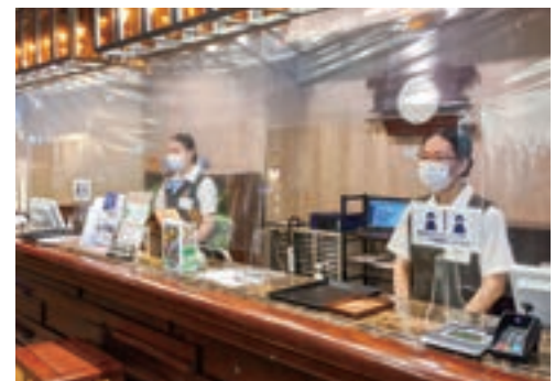
感染防止対策が徹底されているフロントのカウンター

具体的には、①来館時には、サーマルカメラによる検温とアルコール消毒の徹底。ロビーのイスを間引きしたソーシャルディスタンスの確保。チェックイン時のカウンターの飛沫感染防止パネル設置と芳名記帳を別のスペースで行い混雑の緩和を図っています。 ②客室は、徹底したアルコール消毒と清掃時換気の実施。お客様用アルコール消毒設置だけでなく、共用のインフォメーションブックを廃止して、個別に館内案内を用意しています。 ③大浴場は、元々 100 名以上が入浴できますが、混雑状況が WEB サイトで確認することができ、脱衣所のごを間引きしてソーシャルディスタンスの工