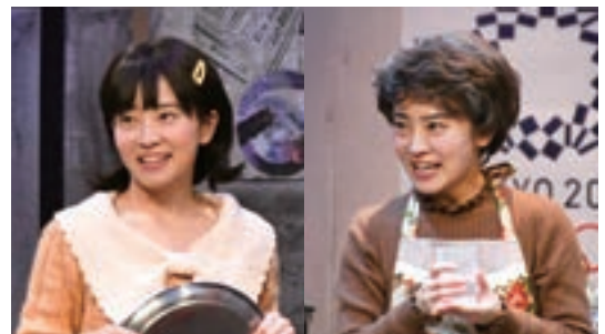
演技力には定評があり、舞台「YESTERDAY ONCE MORE ～あの時君は若かった～」(2019年)では、ヒロインの娘時代と25年後の姿を見事に演じ分けた。

出演のオフアールと中止が続いた中で10月の明治座の舞台が決まり、また突然中止になるかもしれないという不安の中で久しぶりに座組ができ稽古が始まった。やはり役を生きられるのは嬉しい。検温と消毒液、手洗いの励行と共に、マスクとフェイスマスクを付けたままの稽古で相手の表情が見えないもどかしさ。舞台上でも密にならないように演出も変わる。リハーサ