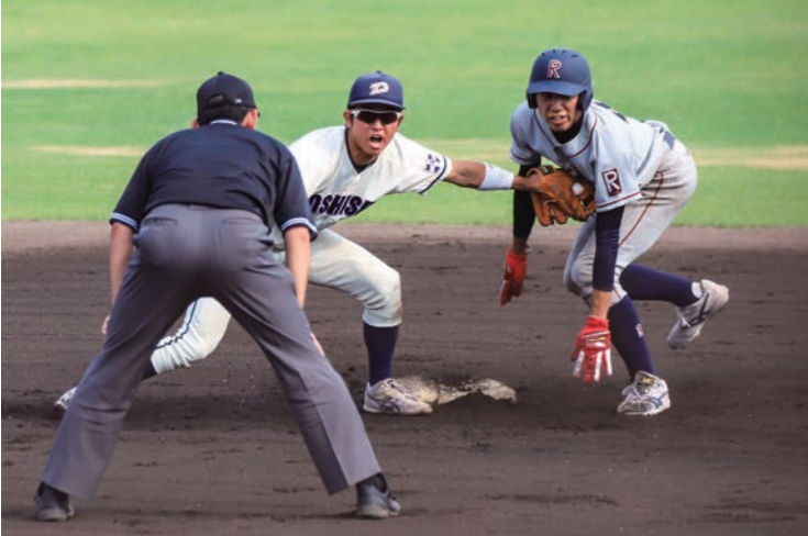
令和初の同立戦は勝ち点獲得ならず

硬式野球部は5季ぶりのAクラス入り。一方ラグビー部は苦戦を強いられた。秋の巻き返しに期待だ。