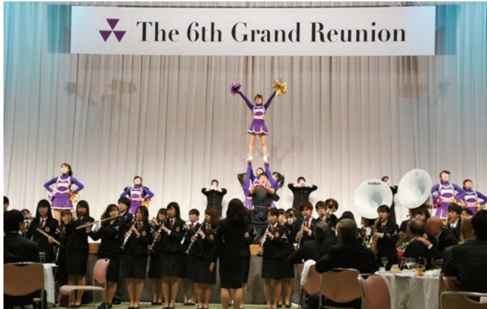
華やかで力強い応援団の演舞

「集まろう! 同志社卒業生」の テーマのもと、全国から700 余名の校友が京都に参集!