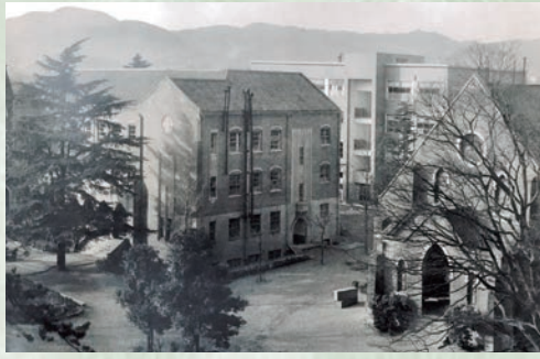
在りし日の同志社中学校

まず小学校との大きな違いは、何といてもチャペルで毎朝行われる礼拝であろう。私は母親の指導で毎日曜日教会学校に通っていたこともあって、礼拝そのものの違和感はなくなかった。クリスチャンの家庭の子供も何人かはいたのだが、ほとんどの生徒は朝から礼拝なんて、恐らく初めての経験だったに違いない。中にはお寺の住職の息子などいたのだが、礼拝