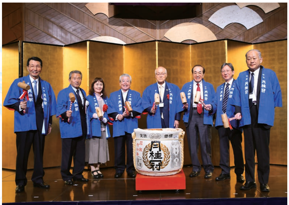
晴れやかな笑顔で、来賓の皆様による鏡開き

実行委員会が最初に議論したのは、今年のテーマを何にするのかということでした。5月1日には新天皇が即位され、新元号が施行されることが決まっていました。新しい時代の始まりです。また、今年は「ラグビーワールドカップ2019日本大会」が開催され、来年は「オリンピック東京2020大会」が開催されます。そこから、「新しい時代」「スポーツ大会」をコンセプトにテーマを決めようということになりました。