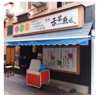
東京校友会常任幹事会も いつもお世話になっています

地下鉄京橋・宝町から徒歩 3 分、同志社大学東京サテライト・キャンパスのすぐ近くの小路の地下にお店はあります。 この地で 2004 年 8 月に「かつぼうぎ」の店名でオープンし、現在の「舌菜魚」には、2016 年 11 月に衣替え。ビジネス街である京橋で、リーズナブルなお店として多くのお客様に支持されています。 昼の部は、主菜 1 品副菜 2 品が選べ、ごはん・味噌汁はかわり自由という和食の基本一汁三菜の三品定食 700 円、持ち帰りのワンコイン (500 円) 弁当が人気で、毎日 220 名ほどのお客様に利用されています。 夜の部は、「ビジネス街の憩いの場」として、こだわりのメニューやお酒をポケットマネーで楽しめる人気のお店です。実は、店名にこのお店のこだわりが表れています。 すなわち、牛舌・旬菜・鮮魚をメインとしたリーズナブルな