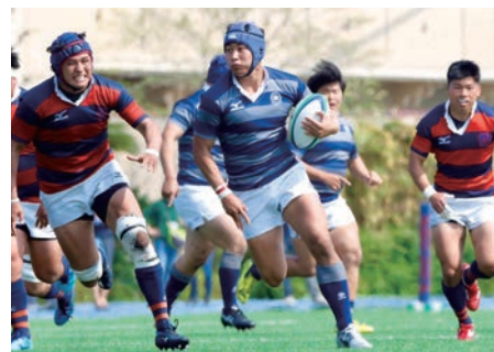
3年ぶりの大学選手権出場を目指すラグビー部