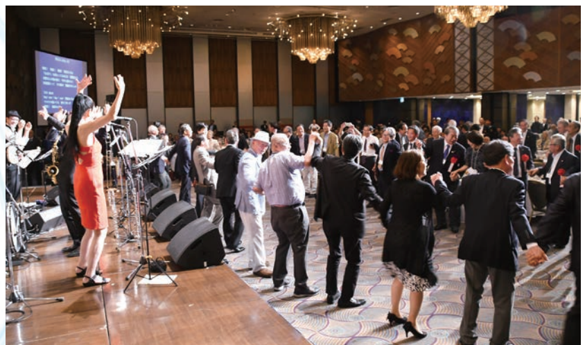
最高調のフィナーレ。みんなが踊りだし、会場はディスコ状態に

メンバー紹介の後、「CDを販売しています」とアピールしてオリジナルナンバーも2曲演奏。熱演につられてか寄付金付きのCDは好調な売れ行き。さらに校友からのリクエストに応え「ジョージア オンマイマイ