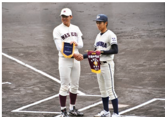
両チーム主将によるペナント交換

れつたい展開で、溝田の粘投に応えられない状況が続く中、5回早稲田は、エラー出塁のランナーを2塁打で2・3塁に進め、ライトライナーで1点先取。 同志社もその後のヒットでホームをついたランナーを本塁上で刺すなど好プレーで応酬しましたが、早稲田の細かい投手リレーに抑えられ、0対1の惜敗で終了しました。 試合後は、両チームで記念写真の撮影を行い、健闘を称えあげました。 文責／青木重之（78年・経）