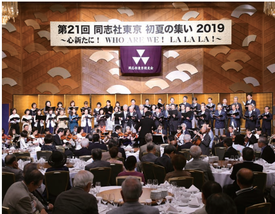
2年ぶりに復活したメサイア演奏。「やっぱり同志社らしい」という声が