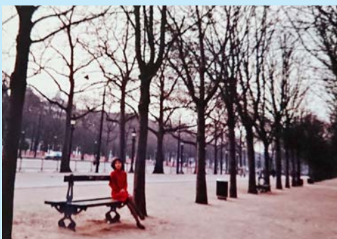
春休みのヨーロッパ旅行、パリにて

思えば学生時代は遠い昔となりました。当時は当たり前のように過ごしていた日々ですが、