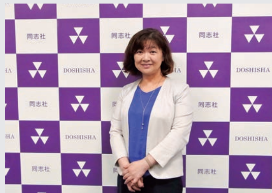
管理会計分野の研究者の顔も

神戸のごく一般的な家庭に育ちました。高校は長田高校。ご存じの進学校で、自分で言うのも何ですが、まあ、優等生的な子供だったと思います。 大学進学の際は、本当は国立志望だったのですが、ちょっと残念な結果になり、父が京大、母が同志社の卒業生でしたので、馴染みのある同志社に進学となりました。 専攻も、みんなが行くから英文学科でいいかぐらいなこと。つまり、この時点では人生の目標も何もなく、すべて流れの中で